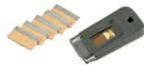
Glasschaber inkl. 5 Ersatzklingen Stück | 40015015