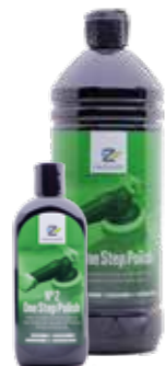
No 2 One Step Polish

Politur auf Basis natürlicher Wachse, polymerer Pflegebestandteile und Schleifmittel. No 2 One Step Polish ist eine Politur, die Lacken einen Tiefenglanz verleiht und gleichzeitig Schleifspuren und Lackunebenheiten beseitigt. Geeignet zur maschinellen und manuellen Verarbeitung.