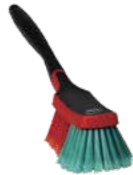
Autobürste mit kurzem Stiel 320 x 130mm Stück | 40021015