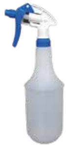
Handsprüher komplett Stück | 40031015