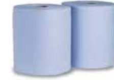
Wischtücher, 3lagig, blau 500 Blatt, 2 Rollen/Paket Stück | 47101015