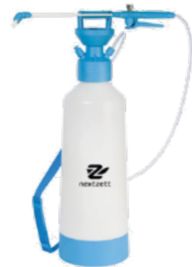
Drucksprühergerät Pro Super 12l • Profi Industrie Drucksprüher • Sprühdüse stufenlos verstellbar • Große Einfüllöffnung • Sprühstange (50cm) aus Fiberglas • Druckaufbau: max. 3,5Bar • Transparente Volumenskala am Tank • Sicherheitsdruckventil • Abgewinkelte Sprühdüse • Großer Standfuß für sicheren Stand • Fassungsvermögen: 12l • Abmessungen: 235 x 235 x 730mm (L x B x H)