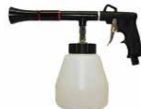
Reinigungspistole Twister Cleaning Gun Stück | 40138315