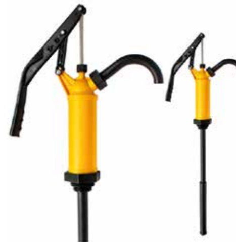
Stück | 40137015

Geeignet für Kanister von 20 Liter bis zu 200 Liter-Fässern. An der Pumpe ist ein Fassadapter mit Gewinde 2" angebracht. Für Plastikfässer und Kanister sind Adapter erhältlich. Die Handpumpe wurde als Siphonpumpe konzipiert und ist für alle neutralen sowie leicht aggressiven Medien geeignet. Die Pumpe darf nicht zum Fördern von Medien der Gefahrenklassen A1/A11, sonstigen brennbaren Medien oder in explosionsgefährdeter Umgebung eingesetzt werden.