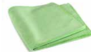
Mikrofasertuch Magic Innen 40 x 40cm 320GSM 5er Pack | 40087015