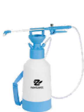
Drucksprühergerät Pro Super 6l • Profi Industrie Drucksprüher • Sprühdüse stufenlos verstellbar • Große Einfüllöffnung • Sprühstange (50cm) aus Fiberglas • Druckaufbau: max. 3,5Bar • Transparente Volumenskala am Tank • Sicherheitsdruckventil • Abgewinkelte Sprühdüse • Großer Standfuß für sicheren Stand • Fassungsvermögen: 6l • Abmessungen: 235 x 235 x 700mm (L x B x H)