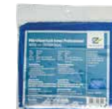
Microfaser Innen Professional 40 x 40cm 280GSM