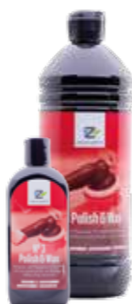
No 3 Polish & Wax

Spezialprodukt auf Basis natürlicher Wachse und polymeren Pflegebestandteilen. Diese hochwertige Autopolitur baut auf allen Metalllacken aber auch Unilacken mit Klarlack einen natürlichen Schutzfilm mit exzellenter Konservierung auf. Geeignet zur maschinellen und manuellen Verarbeitung.