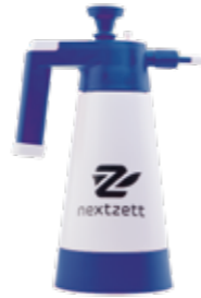
Pumpzerstäuber Profi 1,5l für Lauge Stück | 40037115