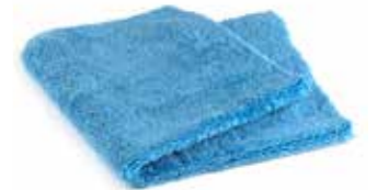
Mikrofasertuch Magic Außen 40 x 40cm 400GSM 5er Pack | 40088015