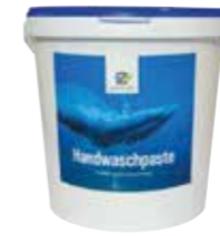
Handwaschpaste Eine leichtlösliche Paste zur hautschonenden Reinigung stark pigment- und fettverschmutzter Hände. Durch Zusatz von Antikalk bei allen Wasserhärten einsetzbar. Handwaschpaste -SF- ist frei von schmirgelnden Holzspänen und Sand. Silikonfrei. 10L | 91331015