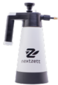
Pumpzerstäuber Profi 1,5l für Lösungsmittel Stück | 40036015