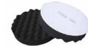
Polierpad No 3 Versiegelung 160 x 30mm, gewaffelt Stück | 40093015