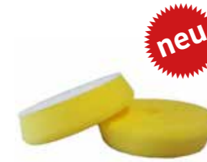
Polierpad No 2 Medium 160 x 30mm Jetzt mit Cooling-Loch Stück | 40092015