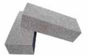
Schwamm für lösungsmittelhaltige Produkte Stück | 41241015