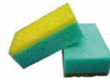
Kombi-Schwamm 130 x 80 x 45mm Stück | 41240615