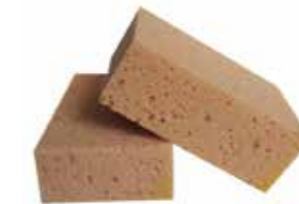
Handschwamm Stück | 41241515