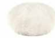
Polierpad Lammfell 80mm Stück | 40090215