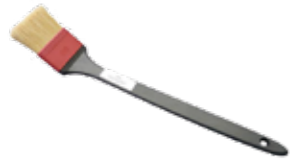
Felgenpinsel 60mm mit Kunststoffeinfassung Stück | 40020015