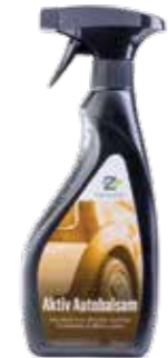
Aktiv Autobalsam mit Frischduft

Mattglänzende, lösemittelfreie Pflege für alle Fahrzeugoberflächen, innen und außen. Makromolekulare, speziell haftende und filmbildende Pflegekomponenten schützen Kunststoff- und Gummiteile wie Stoßstangen, Reifen, Armaturen, Innenverkleidungen sowie Lacke mit einem geschlossenen Schutzfilm. Langzeitwirkung gegen Regen, Schmutz und UV-Strahlung, vorzeitige Alterung und Vergrauung. Im Cockpit bietet Aktiv Autobalsam eine lang anhaltende anti-statische Wirkung gegen Verstauben.