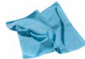
Mikrofasertuch Glassy Profi 40 x 40cm Stück | 40086515