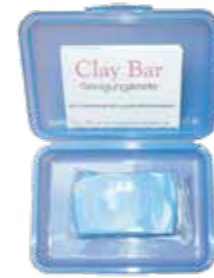
Clay Bar Fine Reinigungsknete Stück | 40040015