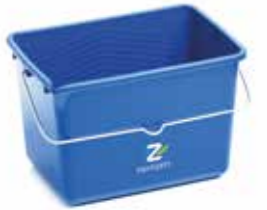
Wascheimer 15l Stück | 40010015