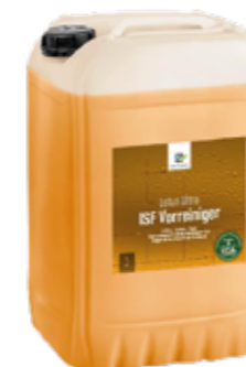
Lotus Ultra ISF Vorreiniger

1000ml | 90140515 10l | 90141515 25l | 90142015 200l | 90143015