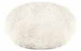
Polierpad Lammfell 150mm Stück | 40090015