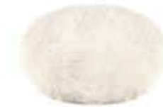
Polierpad Lammfell 130 mm Stück | 40090115