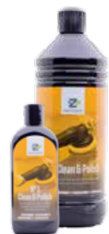
No 1 Clean & Polish

Schleifpaste auf der Basis abgestimmter Schleifmittel unterschiedlicher Körnung, Silikonöl sowie Emulgatoren und Lösungsmittel. Hervorragend geeignet zur maschinellen und manuellen Aufbereitung alter verwitterter Lacke.