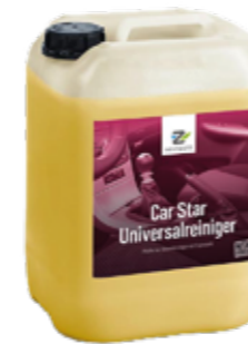
Car Star Universalreiniger

Sehr ergiebiger alkalischer Reiniger, der zuverlässig Öl, tierische und pflanzliche Fette, Insekten, Straßenschmutz, Eiweiß, gealterte Wachs- und Harzverkrustungen sowie verkohlte Rückstände, Copolymerwache und Microstaub entfernt. Eignet sich hervorragend als Vorbehandlungssowie als Bürstenwaschmittel bei der automatischen Nutzfahrzeugwäsche, speziell zum Anlösen von starken Fett- und Ölverschmutzungen auf Planen und Aufliegern. Silikonfrei.