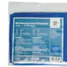
Mikrofasertuch Innen Professional 40 x 40cm 280GSM Stück | 40084015