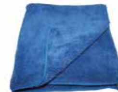
Microfasertuch Polish Plush Deluxe 40 x 40cm 400GSM Stück | 40085015