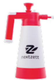
Pumpzerstäuber Profi 1,5l für Säure Stück | 40037015