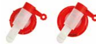
Ablasshahn für 5l, 10l, 25l Kanister 5l/10l Stück | 40133015 25l Stück | 40134015