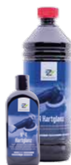
No 4 Hartglanz

Langzeitkonservierung auf Basis natürlicher Wachse und polymeren Pflegebestandteilen, die auf allen Metalllacken aber auch Unilacken mit Klarlack einen natürlichen Schutzfilm mit exzellenter und lang anhaltender Konservierung aufbaut. Geeignet zur maschinellen und manuellen Verarbeitung.