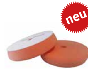
Polierpad No 1 Schleifen 160 x 30mm Jetzt mit Cooling-Loch Stück | 40092515