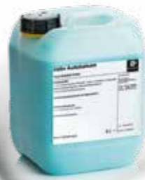
Aktiv Autobalsam mit Frischduft

Mattglänzende, lösemittelfreie Pflege für alle Oberflächen, innen und außen. Makromolekulare, speziell haftende und filmbildende Pflegekomponenten schützen Kunststoff- und Gummiteile wie Stoßstangen, Reifen, Armaturen, Innenverkleidungen sowie Lacke mit einem geschlossenen Schutzfilm. Langzeitwirkung gegen Regen, Schmutz und UV-Strahlung, vorzeitige Alterung und Vergrauung. Im Cockpit wirkt Aktiv Autobalsam lang anhaltend antistatisch gegen Verstauben.