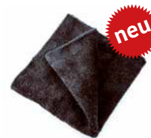
Mikrofasertuch High Gloss Deluxe 40 x 40cm 600GSM Stück | 40086015